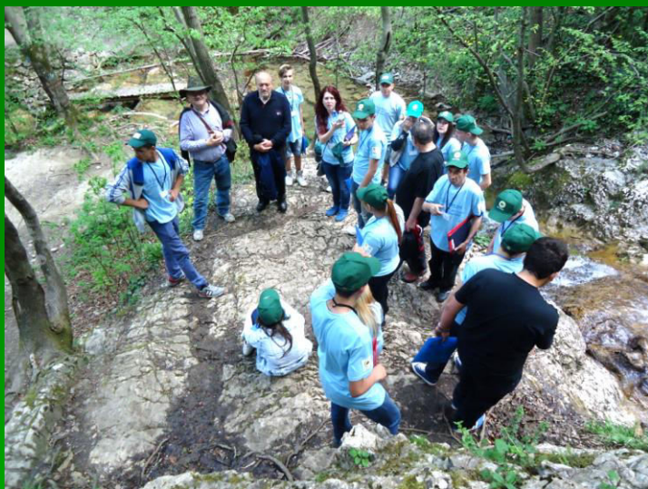
Monitorizarea tăierilor de arbori pe în rezervația naturală Groposu