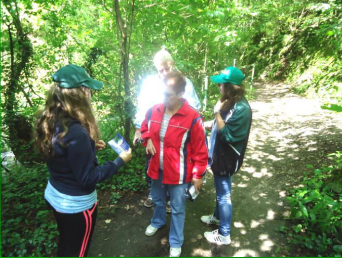
Informarea vizitatorilor rzerwației Bigăr privind regimul de protecție și conservare a biodiversității