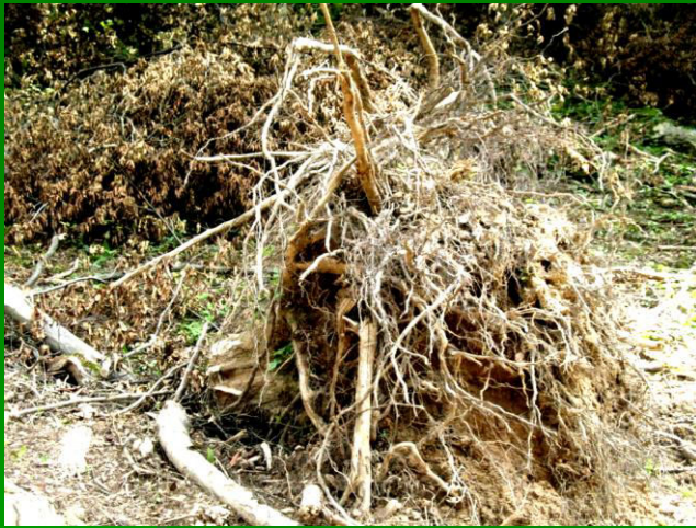
Monitorizarea tăierilor de arbori pe în rezervația naturală Gârliște