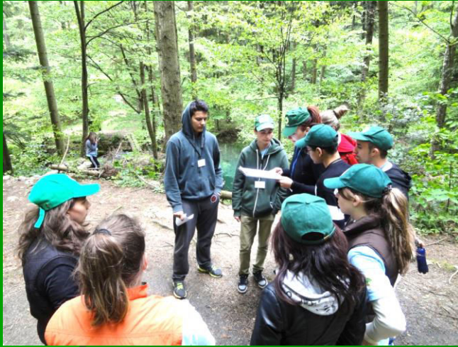
Monitorizarea agresiunilor împotriva tăierilor ilegale de arbori în Parcului Național Semenic - Cheile Carașului