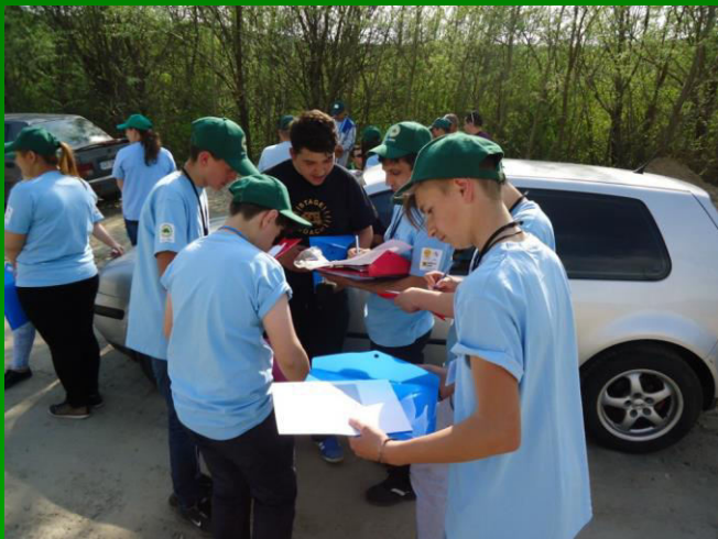
Monitorizarea deponiilor hotice de deșeuri menajere din orașul Oravița